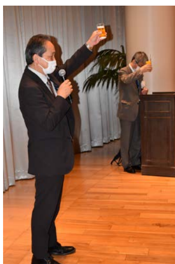
山内副会長 乾杯挨拶