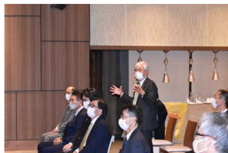
参加者からの質問